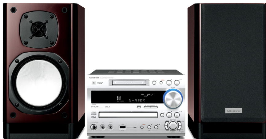
X-N9EX(D) CD/MDチューナーアンプシステム オープン価格 7月10日発売予定